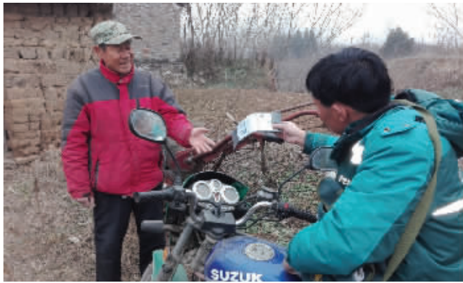
何刘猛给村民送快递