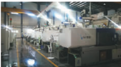
耕德电子产业园订单生产特

在这片充满希望和活力的土地上,示范区人正在以新型城镇化为引领的“三化”协调发展之路上阔步前行,以时不我待、只争朝夕、奋发有为的精神,全面打造“科技新区、绿色新区、富强新区、美丽新区”,以崭新的姿态全面体现一体化和示范带动作用,以改革和发展的新成效迎接时代的浪潮,以优异成绩献礼中华人民共和国成立70周年!