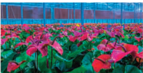
鹤壁建业绿色基地花卉培育智能联动温室大棚