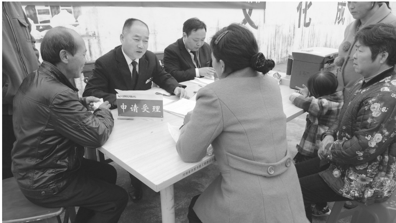
在贫困村开展小额扶贫贷款“集中办贷日”活动

2020年,固始县农商银行严格按照党中央、国务院的决策部署,认真落实各级各部门关于落实“六稳”、“六保”政策各项要求,一手抓好疫情防控,一手抓好信贷服务优化、减费让利政策落实和信贷产品创新,以强有力的金融举措支持企业复工复产,服务好县域经济发展大局。